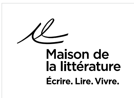
Signature en noir sur fond blanc.