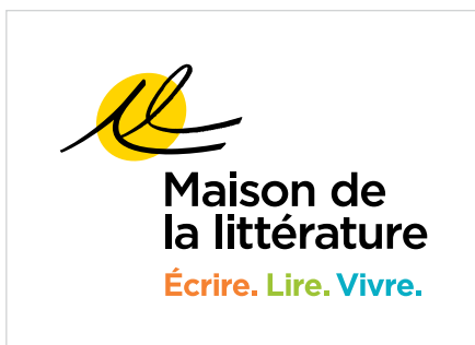
Signature en couleurs sur fond blanc.