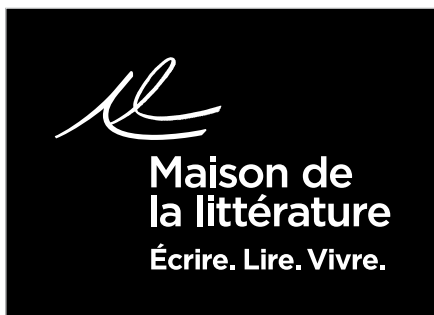
Signature en blanc sur fond noir.