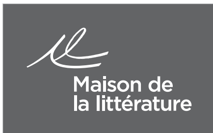
Signature en blanc sur fond noir tramé à 75 %.