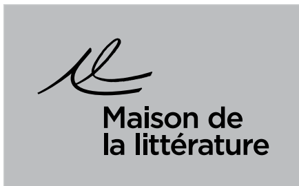
Signature en noir sur fond noir tramé à 30 %.