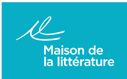
Signature en blanc sur fond de couleur.