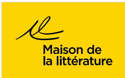
Signature en noir sur fond de couleur.